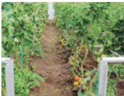
CULTIVOS DE TOMATE GRANJA TOTORILLAS