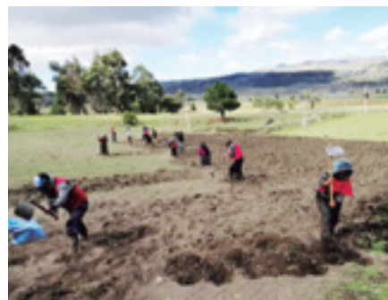
PROCESO DE SIEMBRA GRANJA TOTORILLAS