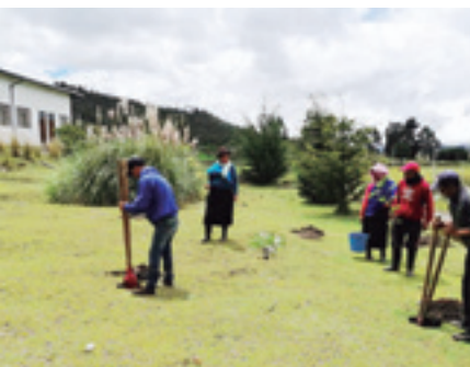
REFORESTACIÓN GRANJA TOTORILLAS