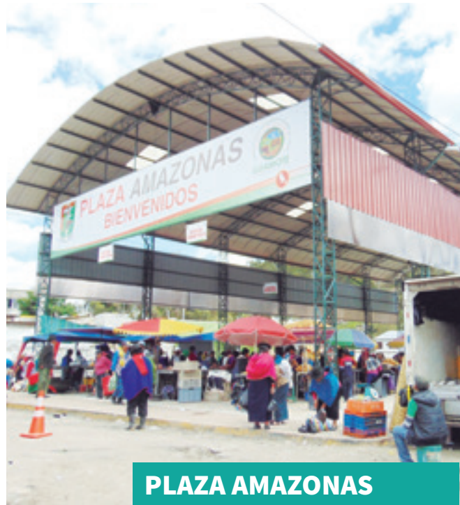
PLAZA AMAZONAS ACTUAL