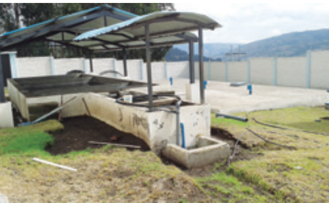
ANTES ASÍ ERA EL AGUA EN GUAMOTE