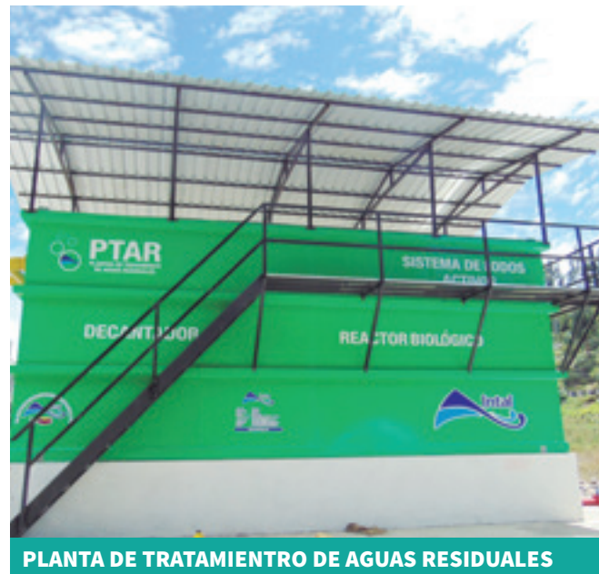
PLANTA DE TRATAMIENTO DE AGUAS RESIDUALES ACTUAL