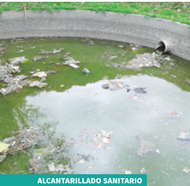
ALCANTARILLADO SANITARIO ANTES