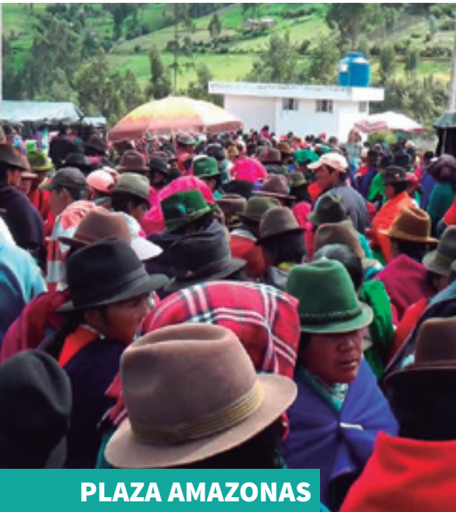
PLAZA AMAZONAS ANTES