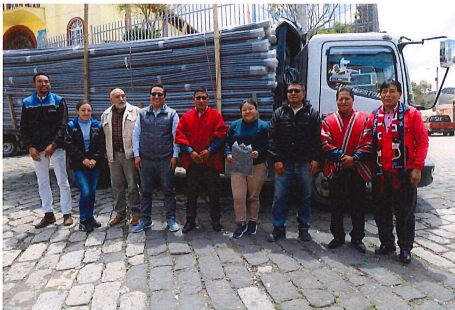
Seguimiento a las actividades en Granja Agro- Turística