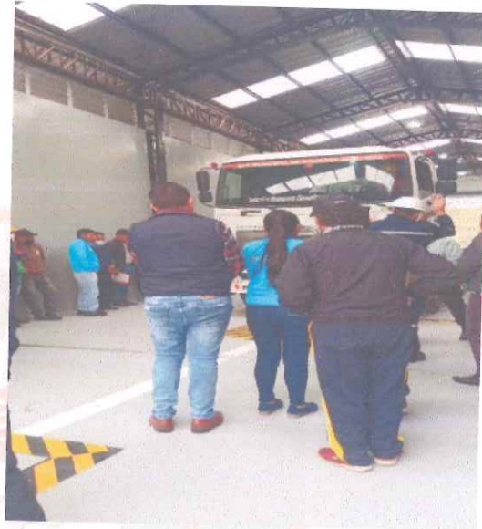
Reunión los comerciantes de plaza san Vicente.